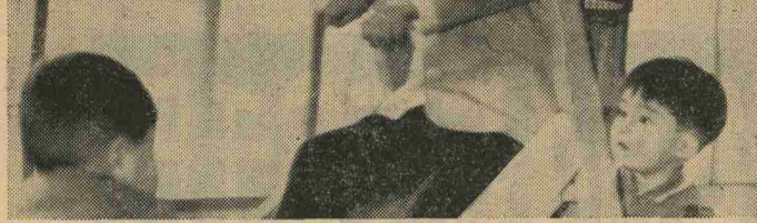
(ぶつかっても いたくないように)