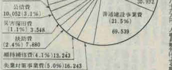
昭和39年度一般会計才入・才出決算表