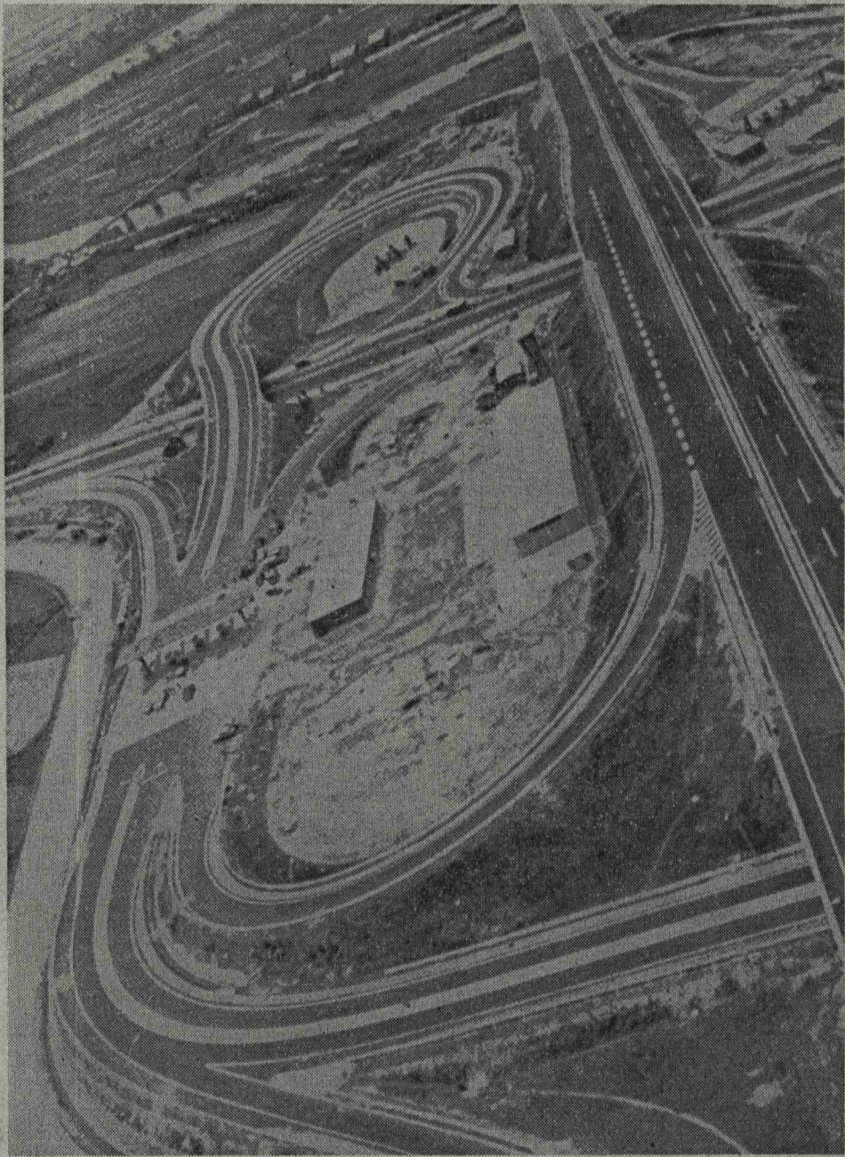
夢みるビジョン?夢ではなく現在完成して、いろいろな車が縦横に走っている名神高速道路のインターチェンジ(この写真は工事中の京都南側が遠賀川ならいいな)

わたしたちの町、水巻でも、そのような動きが、めばえていっています。町と議会は水巻町のマスタープランに真剣にとりこんで、将来の水巻をどのようにしようかと、懸命です。水巻町マスタープランを本月号で紹介したいとおもいます。