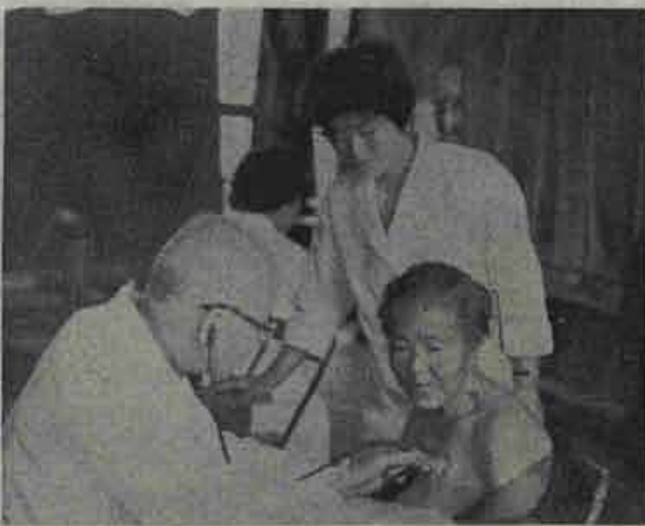
「まだまだ健康で長生きできますよ」と熱心な健康診査風景

くなっている人割合は蛋白の出ている人が1名で全部の37・6%もありました。心臓の無い人は5名でした。結核菌に感染が疑われて精査を要するものがあるものが63名(57・8%)で46名は大体健康でありました。だが今回は第一回目の健康診査で、受ける人もその主旨が分らず、診査の方法も一考を要する点が多くありましたので受診者があまり多くなかったことは本当に残念なことでした。