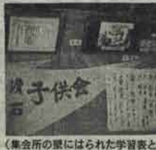
(集会所の壁にはられた学習表と旗)

共同募金が目標額になかなか達しないので関係者はいつも苦勞をしておりますので、このように立場の研修生が積極的な募金をしたというので、募金関係者は感激しております。