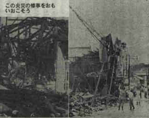
この火災の惨事をおもいおこそう