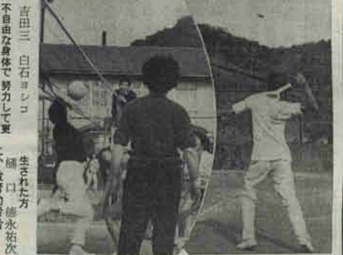
(左) お母さんチームは引力が強い飛びあがれずネットにボールがはねる (右) 秋空にボールが映え優勝戦開始のサーブに力がこもる