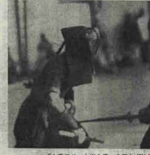
「小手アリッ」出小手一本思わず竹刀を落す 「オーリヤッ」跳ね腰をはずし、切り返す熱戦 女子の部優勝戦一貫色い声援のもと一回戦の終了