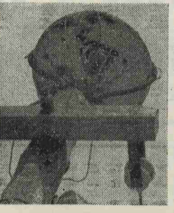
(空気銃で狙い射ちされた水銀灯)

あつ50種程度増水すれば第2配備態勢に入り消防団員を待機させる寸前までいったわけです。