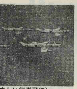
(勇ましい編隊飛行)

高価なものです。植えられた桜は全くとってしまわれスカイスクーター、プランコは一体ごとへ行ったのでしょうか。この姿が現在の荒れ果てた遊園地です。心ない少数の人の仕打ちに子供は声を出して泣いています。