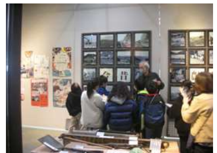
写真でみる昔のくらし