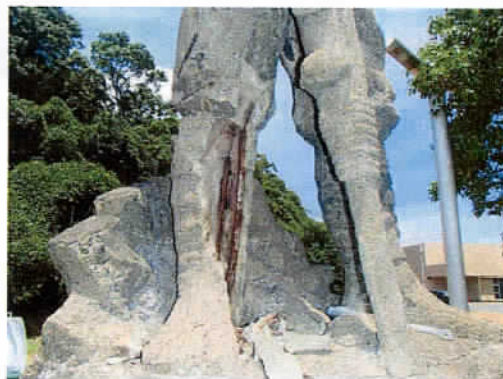
右足の鉄筋の錆（2017年補修時）