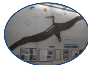
海の時代・大森林の時代イラスト画（村上隆則氏 画）