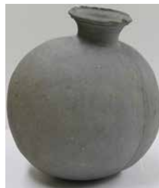
【写真 2】須恵器提瓶 (古墳)