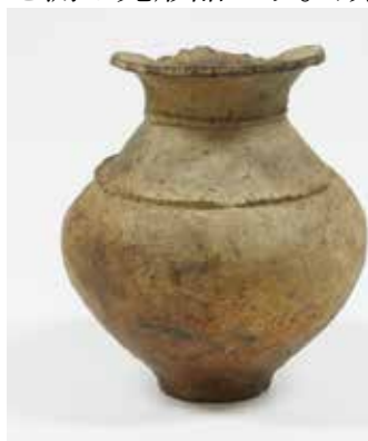
【写真 1】弥生土器小壺 (弥生前期)

1 点目 (写真 1) は弥生土器の小壺で口径 12.0 cm、器高 20.0 cm、底径 6.7 cm、最大幅 18.0 cm を測る完形品です。頸部及び胴部との境に突帯があります。弥生時代前期 (紀元前 2 世紀頃)