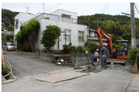
頃末遺跡 A 地点付近下水道工事のようす