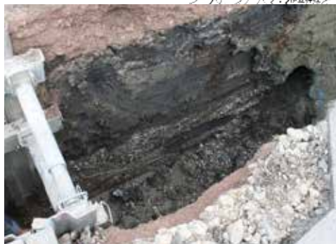
貝層発見の状況と出土品 (右)