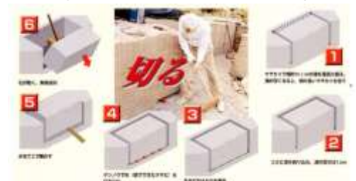
図 2 切抜技法（「石切場を発掘する」『磨かれた技・豊かな自然』（島根県古代文化センター1998 年より）