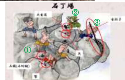
図 1 矢穴技法「甲斐の石積石工技術とその継承」（「山梨県埋蔵文化財センター資料」より）