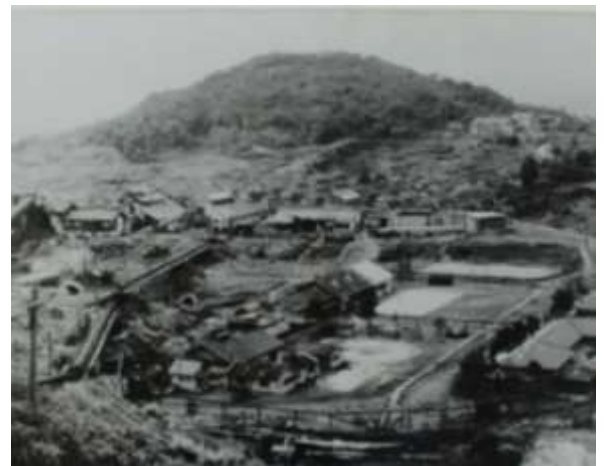
日炭高松第二礦業所坑口周辺風景