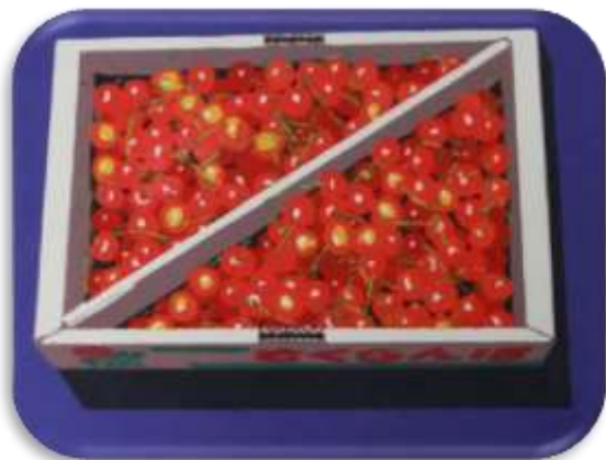
サクランボ 2000 年

今回紹介できた作品はごくわずかですので、今後とも継続的に展示していきたいと思っています。