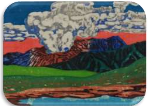
題名・年代不明/木版(多色)/うえだひろし作