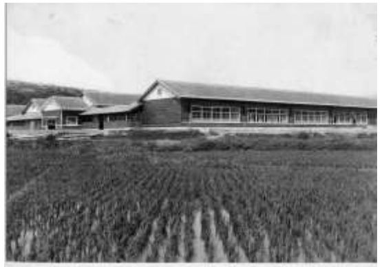
日炭高松礦業学校校舎(1941 年)

この写真資料は当時この学校の生徒だった方が寄贈されたものです。日本炭礦が鉱員養成のため昭和 11 年(1936)私立高松礦業学校として創立したのが始まりで、昭和 23 年(1948)水巻町に管理が移り遠賀農業高等学校水巻分校となり、その後昭和 27 年(1952)町立水巻高等学校となり昭和 38 年(1963)まで続きました。