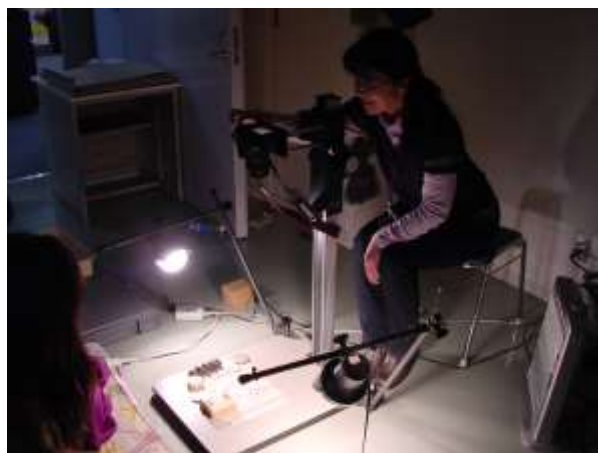
古文書の撮影 (デジタルカメラ)

ほとんどの資料はデジタル化され、データベースに資料登録しました。その成果の一部は 4 月からはじまる新しい歴史資料館のホームページや展示室の利用者端末で随時ご覧いただけるようになります。新ホームページアドレスは http://museum.town.mizumaki.lg.jp/ です。