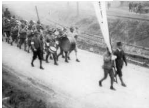
高松礦業学校の行進(1942 年)