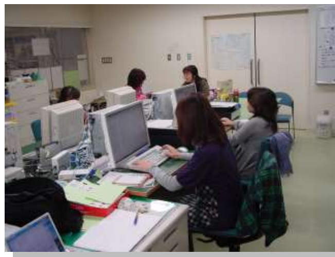
パソコンによる撮影写真データの整理とデータベースへの登録