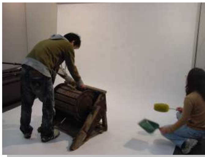
民俗資料の撮影 (デジタルカメラ)