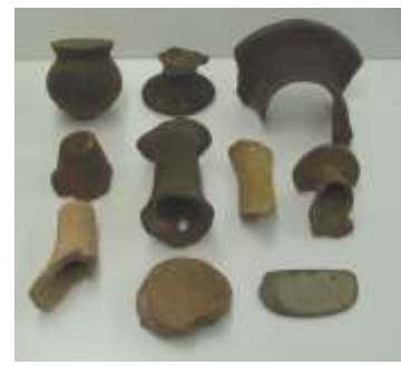
土器・石包丁 6 年生 社会