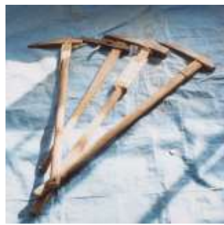
つるはし 4年生 社会