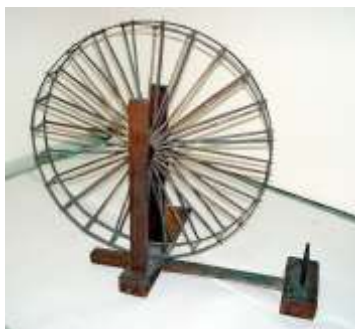
糸車 1年生 国語