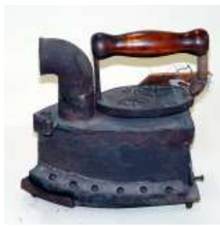
昔のアイロン 4年生 社会