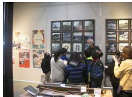
写真でみる昔のくらし