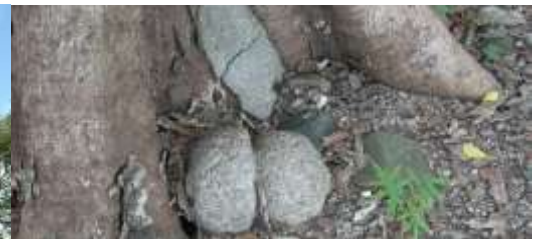
ムクノキの巨木（高さ10m、幹まわり4.35m）と五輪塔の空風輪